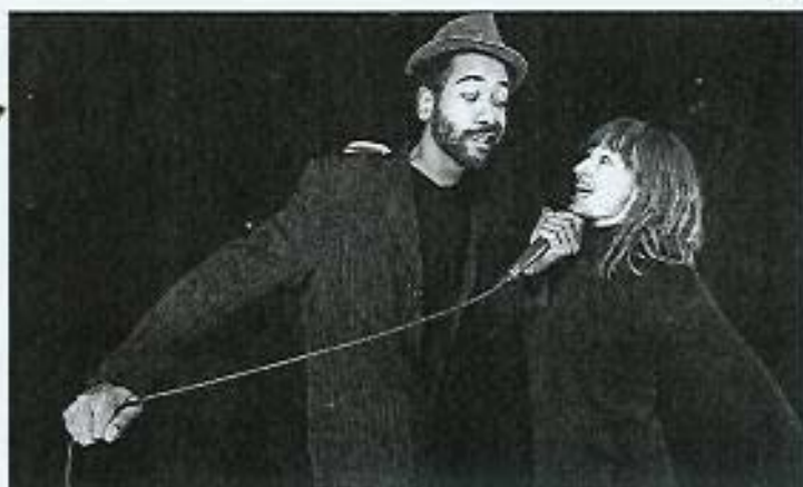
Avant le spectacle de vendredi, deux stages sont proposés aujourd'hui.

Rythmés et arbitrés par la voix d'une human beat box , les uns et les autres s'essaient