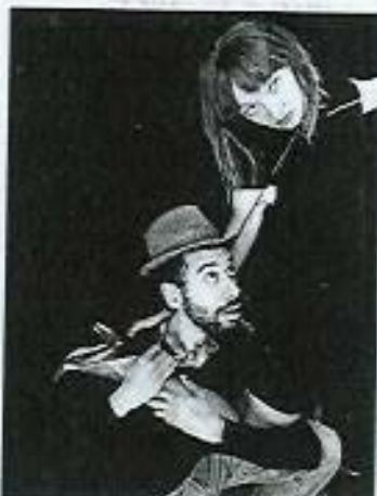
Sur scène, demain, à 21 heures.